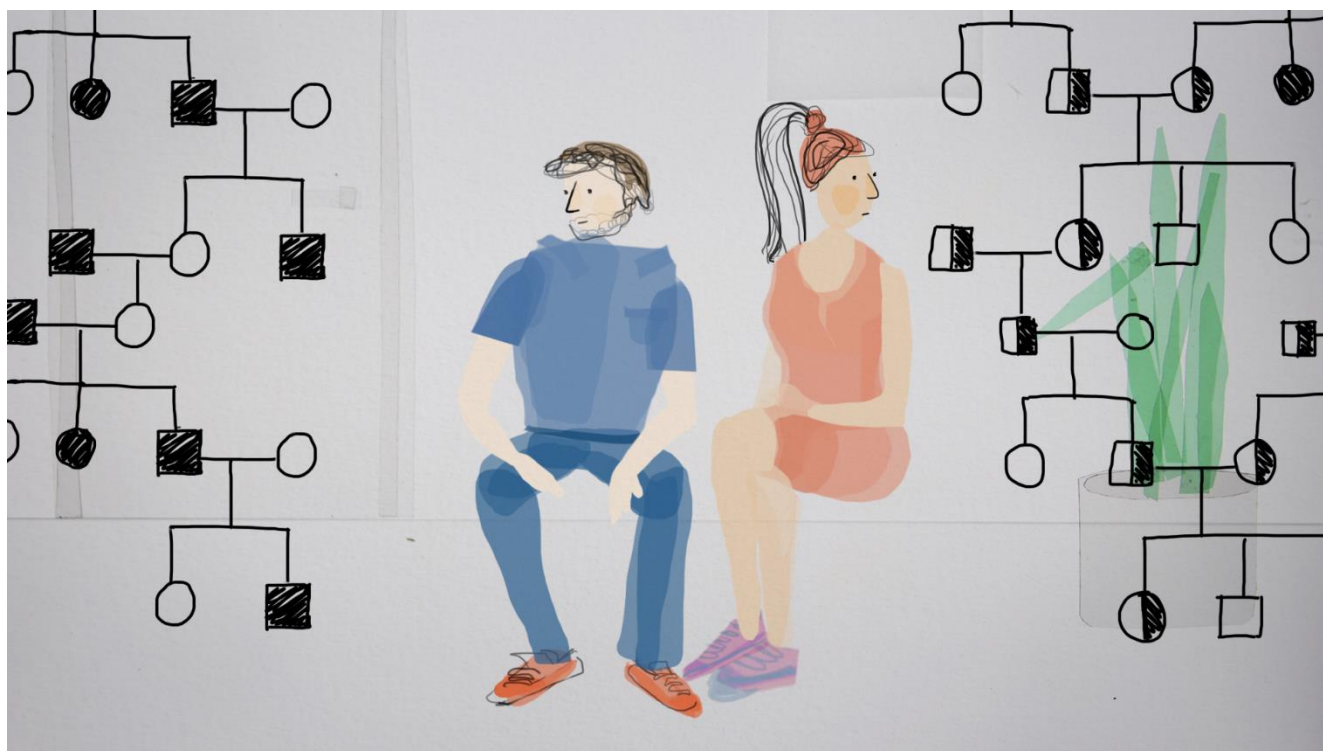
Figuur 1. Een still uit één van de animaties. Tekening van Zaou Vaughan uit een animatie gemaakt door Fast Facts op basis van haar tekeningen.

Afhankelijk van de tijd, het budget, het doel en de doelgroep kan er bepaald worden hoeveel en wat voor scenario's (filmpjes) je kunt ontwikkelen. De DNA-dialoog koos voor animatie als vorm omdat daarmee een goed beeld van een mogelijke toekomst schets gemaakt kon worden. Vanwege het bewaken van de planning en de kwaliteit van de animaties werd voor drie in plaats van vier animaties gekozen. Bij een beperkt budget kan eventueel een geschreven casus, tot stand gekomen met input van (ervarings)deskundigen, een animatie vervangen. Of werken met alleen foto's of tekeningen, gecombineerd met tekst kan een optie zijn. Natuurlijk is er nog veel meer mogelijk.